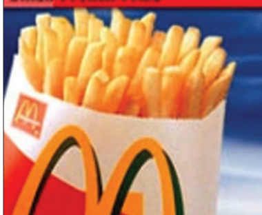
Small French Fries

Una rivista americana di pediatria, "Clinical Pediatrics", nel maggio 2005 a pagina 279 ha pubblicato il contenuto in grassi e in calorie dei cibi di McDonald's. Li pubblichiamo certi di soddisfare le curiosità dei genitori dei nostri pazienti.